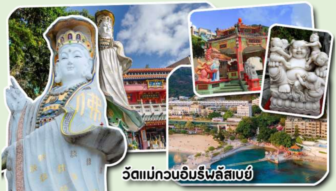
วัดแม่กวนอิมริปลัสเบย์

จากนั้นพาท่านเดินทางต่อไปยัง วัดแม่กวนอิมริมหาดริปลัสเบย์ วัดแห่งนี้ถูกสร้างขึ้นเพื่อคุ้มครองชาวประมงเวลาออกเรือไปหาปลาในสมัยก่อน บริเวณวัดมีสิ่งศักดิ์สิทธิ์มากมาย ได้แก่ เจ้าแม่กวนอิม ประดิษฐานอยู่ทางด้านซ้ายของวัด ซึ่งผู้คนนิยมเดินทางไปกราบไหว้ขอพรเรื่องการมีบุตร และยังมีพระสังกัจจายน์ที่เชื่อกันว่าสามารถขอเพศของบุตรที่จะมาเกิดได้ โดยหลังจากกราบไหว้แล้วก็ให้ลูบที่ท้องของพระสังกัจจายน์ ถ้าอยากได้ลูกชายให้ลูบท้องซ้าย อยากได้ลูกสาวให้ลูบท้องขวา ถัดมาคือ เจ้าแม่ทับทิมเทพีแห่งท้องทะเล ท่านจะคอยคุ้มครองผู้เดินทางทางเรือ หรือผู้ที่เดินทางไปไหนมาไหนท่านจะคอยคุ้มครองให้ปลอดภัย และมีโชคลาภ ถัดจากบริเวณที่กราบไหว้ขอพร ก็จะมีศาลาแปดเหลี่ยมริมน้ำ และสะพานเล็กๆ ที่ชื่อว่าสะพานต่ออายุ ซึ่งเชื่อกันว่าหากเดินข้ามสะพานแห่งนี้ 1 ครั้ง ก็จะมีอายุยืนขึ้น 3 ปี