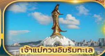
เจ้าแม่กวนอิมริมทะเล