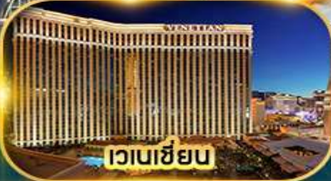
เวเนเซียน