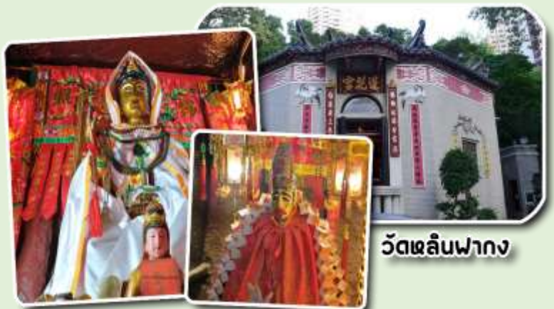
วัดหลินฟา

จากนั้นพาท่านเดินทางสู่ วัดหลินฟา (Lin Fa Kung Temple) หรือ วัดดอกบัว เป็นวัดที่อยู่บริเวณหว่านจ้าย ทางทิศตะวันออกเฉียงเหนือของคอสมเวย์เบย์ โดยวัดนี้จะถูกก่อสร้างในช่วงราชวงศ์ชิง หรือ ปี ค.ศ. 1963 มีการบูรณะอีกครั้งในปี ค.ศ 1986 และ 1999 มีเจ้าแม่กวนอิมเป็นองค์ประธานของวัด โดยมีตำนานเล่าว่า เจ้าแม่