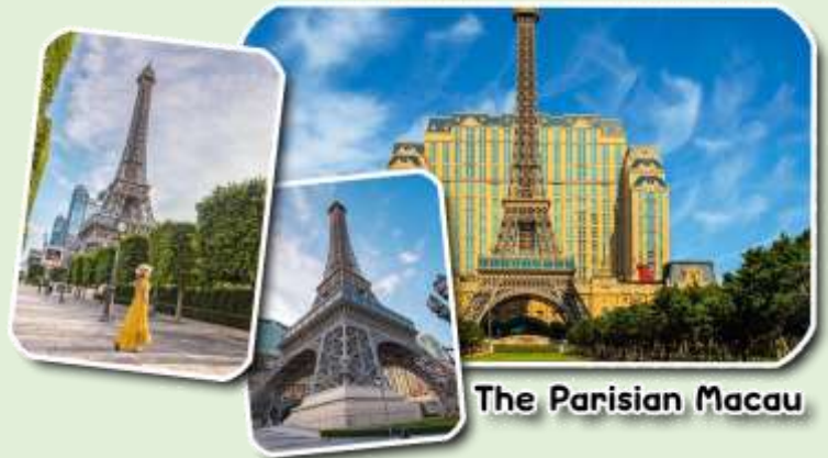
The Parisian Macau

และนำท่านชม The Parisian Macao (เดอะปารีสเซียน มาเก๊า) เป็นอีกหนึ่งแลนด์มาร์คของมาเก๊าที่ได้ยกหอไอเฟลมาจำลองใจกลางเมือง Cotai Strip โรงแรมแห่งนี้ได้รับแรงบันดาลใจมาจากเมืองปารีส ประเทศฝรั่งเศส นครแห่งศิลปะที่มีความงดงามทางด้านสถาปัตยกรรม ความโดดเด่นของหอไอเฟล กลิ่นอายของความคลาสสิกและความโรแมนติกมาไว้ที่โรงแรมแห่งนี้