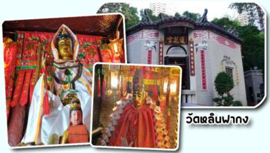
วัดหลินฟาง

นอกจากนี้ทางวัดหลินฟ้าก็ยังมี เทพเจ้า ฮั่วจื่อเฮียะ หรือเทพเจ้าสายนรก เป็นเทพ เจ้าที่ขึ้นชื่อเรื่องกตัญญูที่มาในรูปลักษณะ การนุ่งห่ม ผ้าดิบ ซึ่งเป็นสัญลักษณ์ของการ ไว้ทุกข์ที่คนเชื้อสายจีนให้ความสำคัญ เทพ เจ้าองค์นี้ก็เปี่ยมไปด้วยพลังหยิน ซึ่งเป็น ด้านเกี่ยวกับเงินเงินทองทอง สำหรับผู้ที่ ชอบเสี่ยงโชค