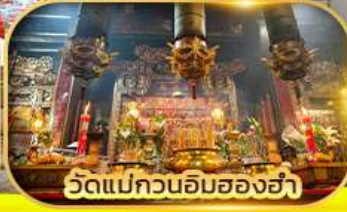
วัดแม่กวนอิมสองฮา