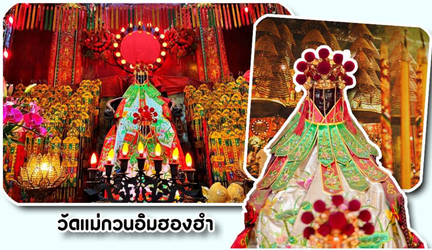
วัดแม่กวนอิมสองฮ้า

จากนั้นพาท่านเข้าไปไหว้ขอพร วัดแม่กวนอิมสองฮ้า วัดเก่าแก่ของฮ่องกงสร้างตั้งแต่ปี ค.ศ. 1873 เป็นวัด ขนาดเล็กที่มีชาวฮ่องกงศรัทธานับถือกันเป็นอย่างมากวัดแห่งนี้เป็นที่ประดิษฐาน องค์เจ้าแม่กวนอิมสองฮ้า ที่มี ชื่อเสียงเรื่องการให้กู้ยืมเงินเชื่อกันว่าท่านช่วยพลิกฟื้นเศรษฐกิจของชาวฮ่องกง ผู้คนจึงนิยมมาเยี่ยมเงินทำธุรกิจจนสำเร็จ ร่ำรวย รุ่งเรืองโดยให้ท่านอธิษฐานขอพรต่อหน้า เจ้าแม่กวนอิมสองฮ้าพร้อมกับระบุวันเวลาในการขอพรด้วย จากนั้นนำ ธูปธูปตามฐานะและศรัทธาที่เราจะนำเป็นสื่อในการขอพร เขียนจำนวนเงินที่ต้องการลงไปด้วย ใส่สกุลเงินยิ่งดีใหญ่ แล้ว นำเงินใส่ในซองแดง ควรเตรียมซองแดงไปเอง นำซองแดงไปวนรอบกระถางรูป วนขวาจำนวน 3 ครั้ง แล้วเก็บซองแดงใน กระเป๋าสตางค์ เป็นเงินขวัญถุง ถ้าประสบความสำเร็จตามที่มุ่งหวัง ให้นำเงินในซองแดงทำบุญหยอดตู้ที่วัดแห่งนี้ในโอกาส ต่อไป