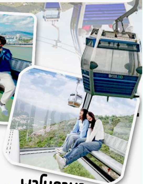
พานิราม่า