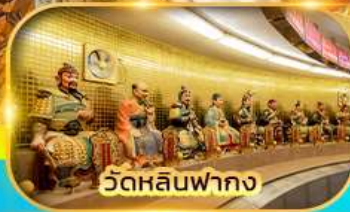
วัดหลินฟาถง