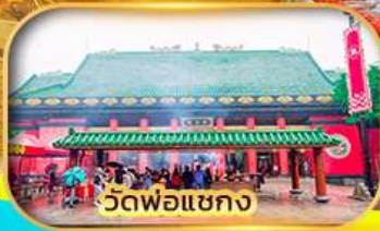
วัดผ้อแซก