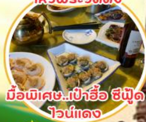
มือพิเศษ...เป่าฮ้อ ซิฟูด ไวน์แดง