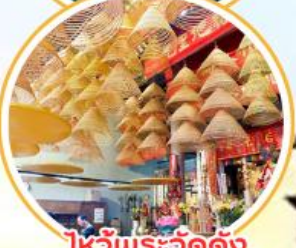
ไหว้พระวัดดัง