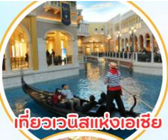
เที่ยวเวนิสแห่งเอเชีย

รหัสโปรแกรม : 42828 (กรุณาแจ้งรหัสโปรแกรมทุกครั้งที่สอบถาม)