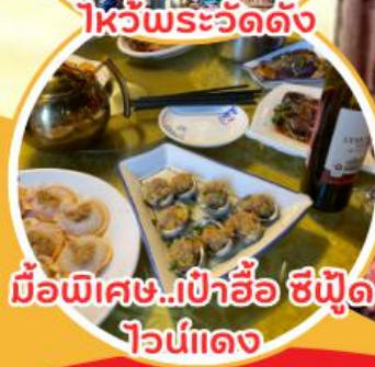
มือพิเศษ...เป่าฮ้อ ซีฟูด ไวน์แดง