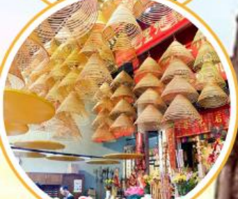
หัวพระวัดดัง