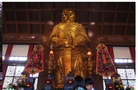
วัดแชกงเมียว

วันที่สี่ เมืองจูไห่-สะพาน HZMB-ฮ่องกง – อ่าวรีพลัสเบย์ –จุดชมวิวไท่ผิงซาน-วัดแชกง-โรงงานจิวเวลรี่-อิสระซ้อปิ้งย่านจิมซาจุ่ยจูไห่