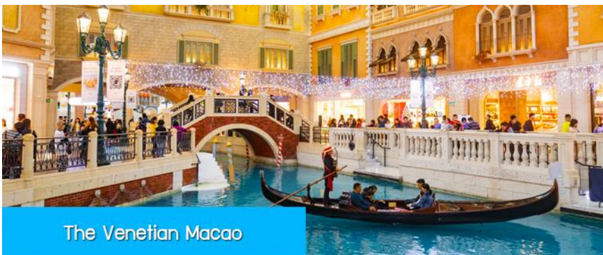
The Venetian Macao