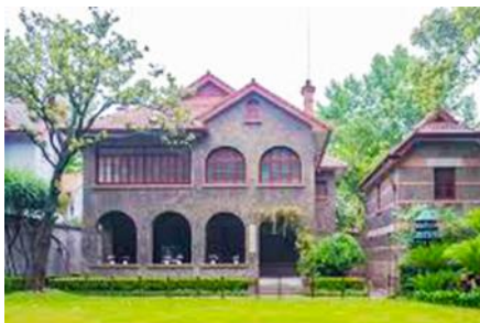
บ้านเกิดซุนยัตเซน

พักที่ IRVINE HOLIDAY HTL OR HUICHANG HTL 3* หรือโรงแรมในระดับเดียวกันในเมืองจูไห่