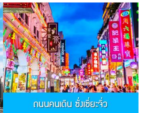
ถนนคนเดิน ซังเซี่ยจิว