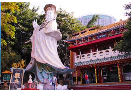
อ่าว Repulse Bay