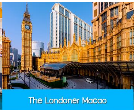
The Londoner Macao

นำคณะขึ้นรถ Shuttle Bus ของโรงแรมเดินทางสู่ เดอะปารีสเซียน มาเก๊า The Parisian Macao และ เดอะลอนดอนเนอร์ the Londoner Macao อัครสถานบันเทิงที่สร้างขึ้นเป็นดาวดวงใหม่ที่เจิดจรัสอยู่เหนือเกาะ