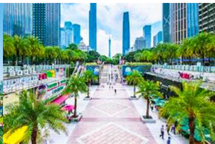
จตุรัสฮัวถิง