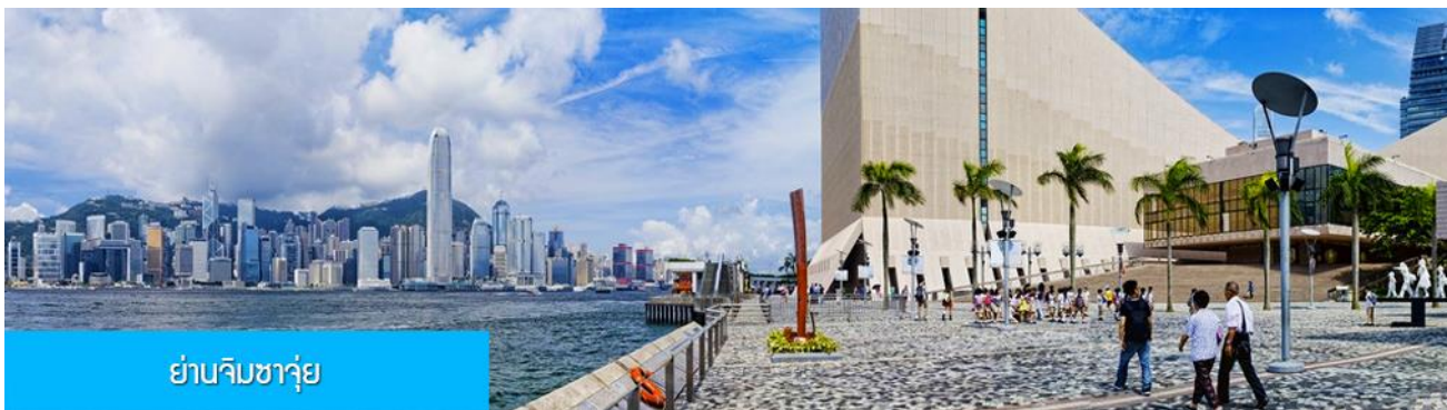
ย่านจิมซาจุ่ย