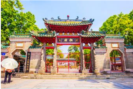
วัดงู่เมี่ยว

23.30 น. คณะพร้อมกัน ณ ท่าอากาศยานสุวรรณภูมิ อาคารผู้โดยสารขาออก ชั้น 4 ประตู 10 เคาน์เตอร์สายการบิน 9AIR พบเจ้าหน้าที่บริษัทฯ คอยให้การต้อนรับและอำนวยความสะดวกด้านเอกสารและสัมภาระก่อนการเดินทาง