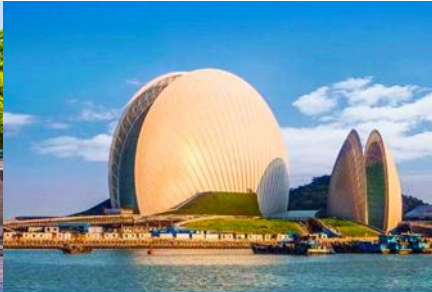
โรงละครงู่ไห่