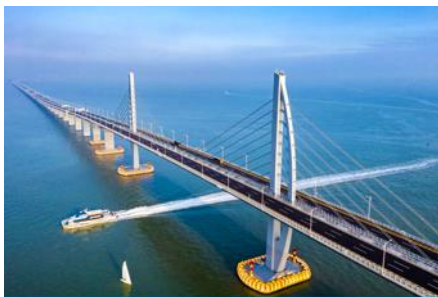
สะพาน ฮ่อกง จูไห่ มาเก๊า

พักที่ IRVINE HOLIDAY HTL OR HUICHANG HTL 3* หรือโรงแรมในระดับเดียวกันในเมืองจูไห่