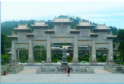
วัดผู้ไถวชื่อ