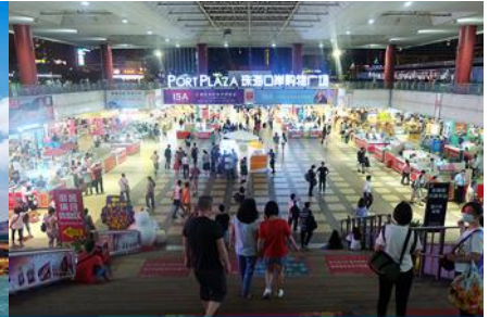
ตลาดใต้ดินกงเป๋ย