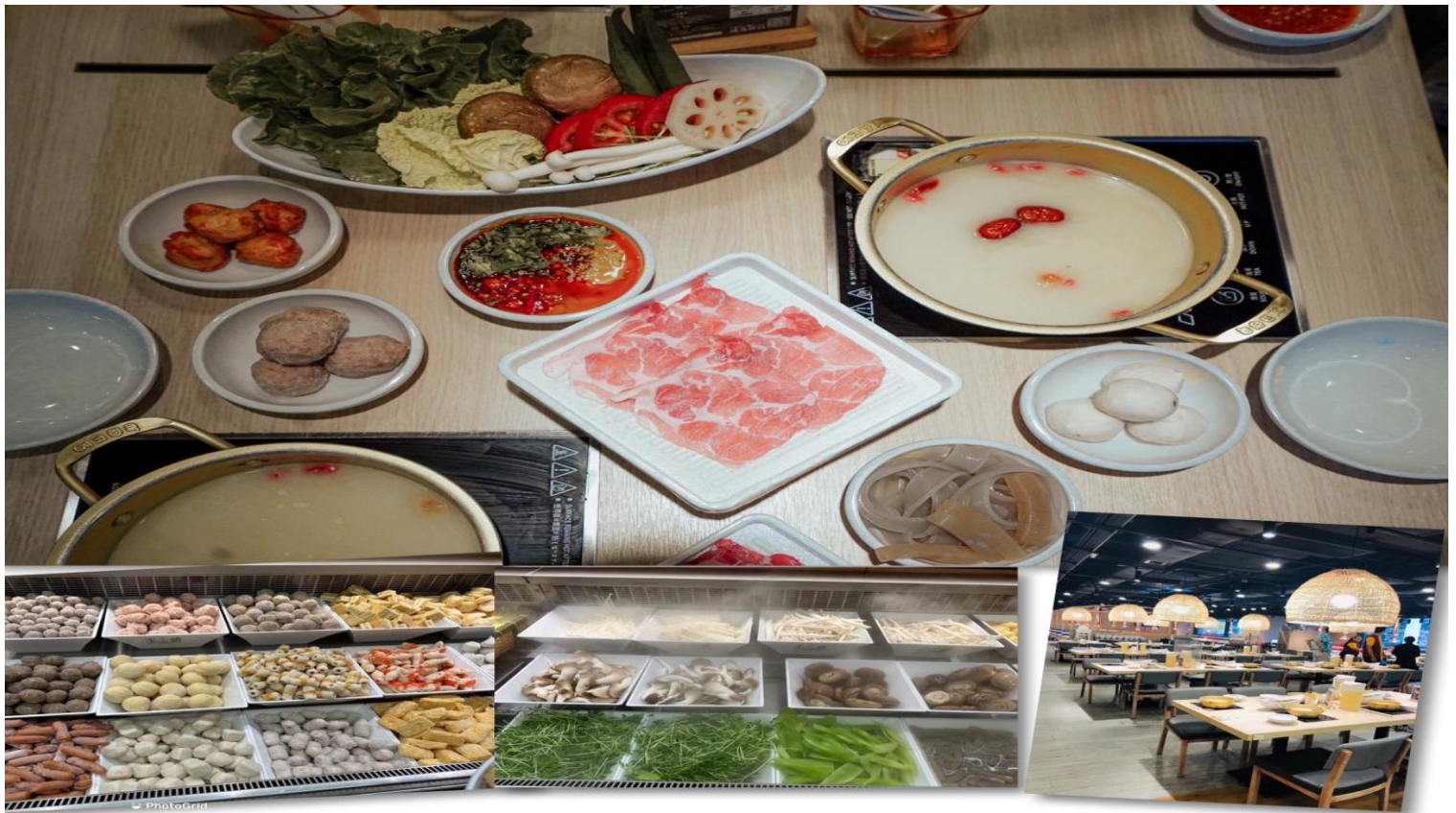
เที่ยง รับประทานอาหารเที่ยง 101 (3) เมนูชาบู