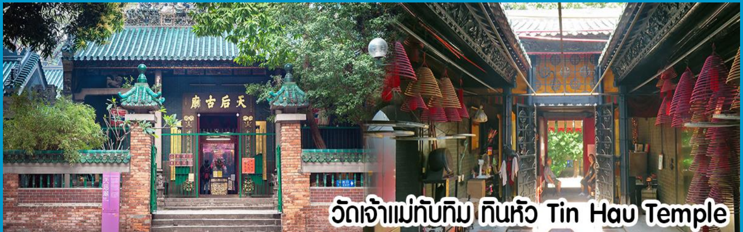
วัดเจ้าแม่ทับทิม ทินหัว Tin Hau Temple

นำทุกท่าน ไหว้ศาลเจ้าแม่ทับทิม ทินหัว (Tin Hau Temple) เป็นวัดเก่าแก่และสำคัญอีกวัดหนึ่งของฮ่องกง เพราะในสมัยก่อนฮ่องกงเป็นเพียงหมู่บ้านชาวประมง ซึ่งเคารพนับถือเจ้าแม่ทับทิมว่าเป็นเทพีแห่งทะเล เพื่อให้เดินทางปลอดภัย เวลาออกไปทำงานไกล ๆ หรือออกหาปลา นอกจากการมาสักการะบูชาเจ้าแม่ทับทิมในเรื่องของการเดินทางให้ปลอดภัยแล้ว ไฮไลท์สำคัญอีกอย่างหนึ่งของ วัดเจ้าแม่ทับทิม ทินหัว (Tin Hau Temple) จะเป็นขดรูปสี่แดงขนาดใหญ่ ที่แขวนอยู่ตามเพดานด้านในวิหารของวัดเต็มไปหมด จะยิ่งสวยงามในยามที่มีแสงแดงส่องลงมาเหมือนเป็นลำแสงส่องทะเลดูวันรูปแปลกตายิ่งนัก ส่วนอาคารของวัดก็จะเป็นสถาปัตยกรรมแบบวัดจีน สร้างขึ้นตั้งแต่ปีค.ศ. 1876 โดยทางเข้าของวัดจะอยู่ติดกับสวนสาธารณะเล็ก ๆ ที่มีต้นไม้ใหญ่หลายต้น ให้บรรยากาศร่มรื่น