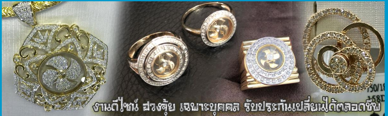
งานดีไซน์ ฝังอัญมณี เหนาะบุคคล รับประกันเปลี่ยนไม่ได้ตลอดชีพ

นำท่านเยี่ยมชม โรงงานจิวเวลรี่ ที่ขึ้นชื่อของฮ่องกงพบกับงานดีไซน์ที่ได้รับรางวัลอันดับยอดเยี่ยม และใช้ในการเสริมดวงเรื่อง ฮวงจุ้ยนำความโชคดี มั่งคั่งแก่ผู้สวมใส่ ซึ่งในเมืองไทยก็ได้นิยมแพร่หลายออกไป ไม่ว่าจะเป็นกลุ่ม ดารา นักการเมือง พ่อค้าแม่ขายที่ประกอบธุรกิจ เจ้าของกิจการห้างร้านต่าง ๆ ซึ่งเชื่อกันว่าจะนำสิ่งดี ๆ ปิดเป่าสิ่งชั่วร้ายให้กับบุคคลที่สวมใส่ ซึ่งจะมีมากมายหลายชนิด เช่นจี้กั๊กกัน แหวนรุ่นต่าง ๆ นาฬิกาข้อมือ (ซึ่งผู้สวมใส่จะได้รับการดูลายมือจากซินเซปประจำร้าน เพื่อนำวิธีการเสริมดวงในการสวมใส่โดยไม่ติดต่อบริการ)