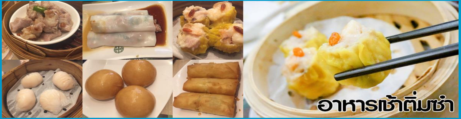
อาหารเช้าต้มซ่า

นำทุกท่าน ไหว้ศาลเจ้าแม่ทับทิม ทินหัว (Tin Hau Temple) เป็นวัดเก่าแก่และสำคัญอีกวัดหนึ่งของฮ่องกง เพราะในสมัยก่อนฮ่องกงเป็นเพียงหมู่บ้านชาวประมง ซึ่งเคารพนับถือเจ้าแม่ทับทิมว่าเป็นเทพีแห่งทะเล เพื่อให้เดินทางปลอดภัย เวลาออกไปทำงานไกล ๆ หรือออกหาปลา นอกจากการมาสักการะบูชาเจ้าแม่ทับทิมในเรื่องของการเดินทางให้ปลอดภัยแล้ว ไฮไลท์สำคัญอีกอย่างหนึ่งของ วัดเจ้าแม่ทับทิม ทินหัว (Tin Hau Temple) จะเป็นขดรูปสี่แดงขนาดใหญ่ ที่แขวนอยู่ตามเพดานด้านในวิหารของวัดเต็มไปหมด จะยิ่งสวยงามในยามที่มีแสงแดงส่องลงมาเหมือนเป็นลำแสงส่องทะเลดูวันรูปแปลกตายิ่งนัก ส่วนอาคารของวัดก็จะเป็นสถาปัตยกรรมแบบวัดจีน สร้างขึ้นตั้งแต่ปีค.ศ. 1876 โดยทางเข้าของวัดจะอยู่ติดกับสวนสาธารณะเล็ก ๆ ที่มีต้นไม้ใหญ่หลายต้น ให้บรรยากาศร่มรื่น