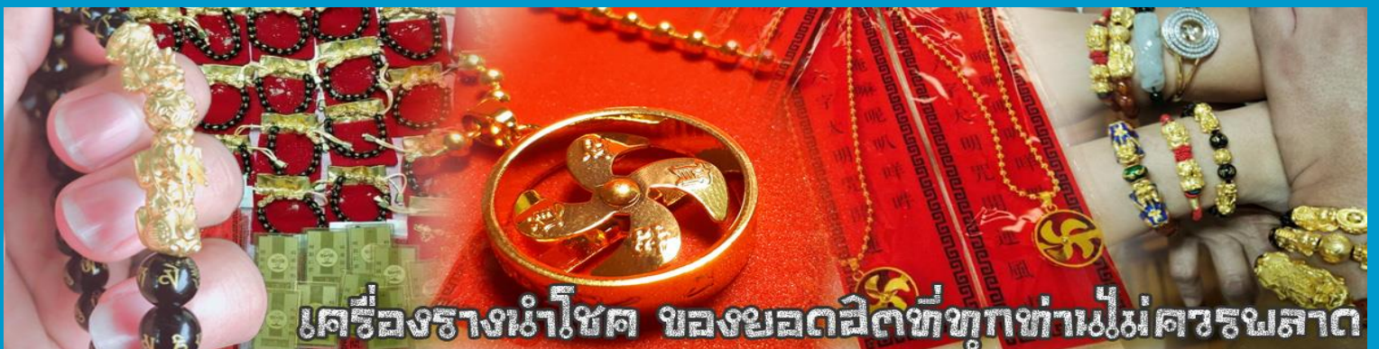
เครื่องรางนำโชค ขลงขมดลิตที่ทุกท่านไม่ควรพลาด

จากนั้นนำท่านสู่ ร้านหยก ชมความงามปีเซียะ ที่เชื่อกันว่าเป็นวัตถุมงคลยอดนิยม ที่มีการนำมาบูชา เพื่อให้ช่วยป้องกันสิ่งชั่วร้าย เรียกทรัพย์สินเงินทองให้ไหลมาเทมา และกักเก็บทรัพย์นั้นไม่ให้รั่วไหลออกไปไหนได้ ชาวจีนโบราณเชื่อกันว่า ปีเซียะเป็นสัตว์ประหลาดที่รวมลักษณะของสัตว์มงคลทั้ง 5 ชนิดไว้ด้วยกัน ได้แก่ มังกร พญาราชสีห์หรือสิงโต, อินทรี, กวาง, และแมว โดยตามตำนานเล่าว่า ปีเซียะเป็นลูกมังกรตัวที่ 9 (เทพแห่งโชคลาภ) ของพญามังกรสวรรค์ มีชื่อเรียกด้วยกันหลายชื่อไม่ว่าจะเป็น “เทียนลก (กวางสวรรค์)” เป็นชื่อเต็ม ส่วนจีนกวางตุ้งจะเรียกว่า “เผ่เฮ่า” และคนจีนแต้จิ๋วจะเรียกว่า “ผีซิว”