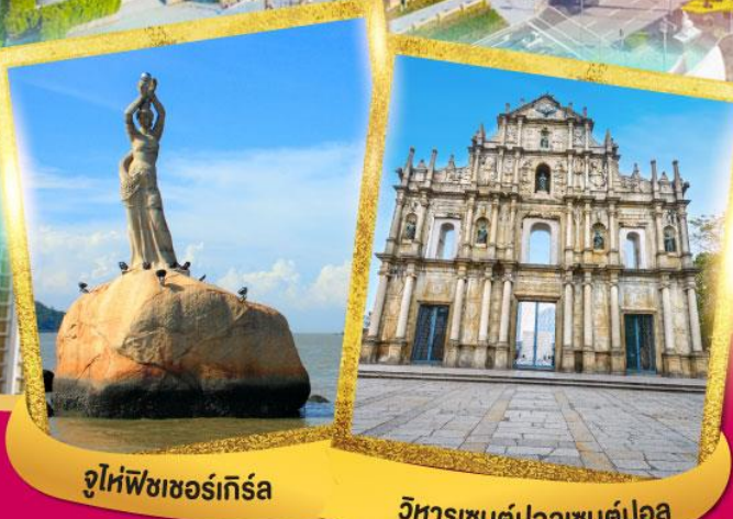
จูไห่พีชเชอร์เกิร์ล