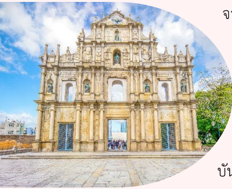
แห่งเดียวเท่านั้นในโลก

จากนั้นนำท่านชม วิหารเซนต์ปอล (Ruins of St. Paul's) โบสถ์แห่งนี้เคยเป็นส่วนหนึ่งของวิทยาลัยเซนต์ปอล ซึ่งก่อตั้งในปี ค.ศ. 1594 และปิดไปในปี ค.ศ. 1762 และเป็นมหาวิทยาลัยตามแบบตะวันตกแห่งแรกของเอเชียตะวันออก โบสถ์เซนต์ปอลสร้างขึ้นในปี ค.ศ. 1580 แต่ถูกทำลายถึงสองครั้ง ในปี ค.ศ. 1595 และ ค.ศ. 1601 ตามลำดับ จนกระทั่งเกิดเพลิงไหม้ในปี ค.ศ. 1835 ทั้งวิทยาลัย และโบสถ์ถูกทำลายจนเหลือแต่ด้านหน้าของตึกฐานโบสถ์ส่วนใหญ่และบันไดด้านหน้าของตึกแสดงให้เห็นถึงสไตล์ผสมระหว่างตะวันออกและตะวันตกและมีอยู่ที่นี่เพียง