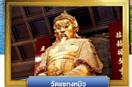
วัดเขกทมิว