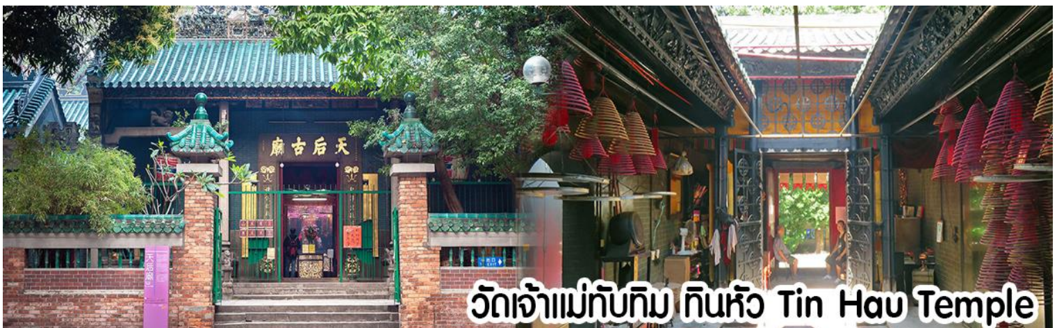
วัดเจ้าแม่ทับทิม ทินหัว Tin Hau Temple

นำทุกท่าน ไหว้ศาลเจ้าแม่ทับทิม ทินหัว (Tin Hau Temple) เป็นวัดเก่าแก่และสำคัญอีกวัดหนึ่งของฮ่องกง เพราะในสมัยก่อนฮ่องกงเป็นเพียงหมู่บ้านชาวประมง ซึ่งเคารพนับถือเจ้าแม่ทับทิมว่าเป็นเทพีแห่งทะเล เพื่อให้เดินทางปลอดภัย เวลาออกไปทำงานไกล ๆ หรือออกหาปลา นอกจากการมาสักการะบูชาเจ้าแม่ทับทิมในเรื่องของการเดินทางให้ปลอดภัยแล้ว ไฮไลท์สำคัญอีกอย่างหนึ่งของ วัดเจ้าแม่ทับทิม ทินหัว (Tin Hau Temple) จะเป็นขดรูปสี่แดงขนาดใหญ่ ที่แขวนอยู่ตามเพดานด้านในวิหารของวัดเต็มไปหมด จะยิ่งสวยงามในยามที่มีแสงแดงส่องลงมาเหมือนเป็นลำแสงส่องทะเลดุจวันรูปแปลกตายิ่งนัก ส่วนอาคารของวัดก็จะเป็นสถาปัตยกรรมแบบวัดจีน สร้างขึ้นตั้งแต่ปีค.ศ. 1876 โดยทางเข้าของวัดจะอยู่ติดกับสวนสาธารณะเล็ก ๆ ที่มีต้นไม้ใหญ่หลายต้น ให้บรรยากาศร่มรื่น