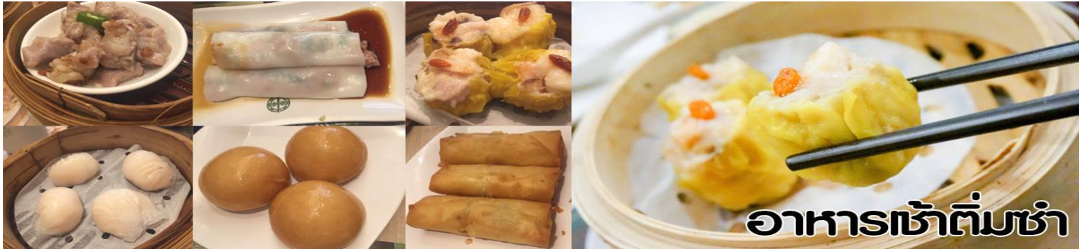
อาหารเช้าติ่มซำ

นำท่านไปไหว้ เจ้าแม่กวนอิมสงอำ (Kun Im Temple Hung Hom) เป็นวัดเจ้าแม่กวนอิมที่มีชื่อเสียงแห่งหนึ่งในฮ่องกง ขอพรเจ้าแม่กวนอิมพระโพธิสัตว์แห่งความเมตตา ช่วยคุ้มครองและปกป้องรักษาวัดเจ้าแม่กวนอิมที่ Hung Hom หรือ “Hung Hom Kwun Yum Temple” เป็นวัดเก่าแก่ของฮ่องกงสร้างตั้งแต่ปี ค.ศ. 1873 ถึงแม้จะเป็นวัดขนาดเล็กที่ไม่ได้สวยงามมากมาย แต่เป็นวัดเจ้าแม่กวนอิมที่ชาวฮ่องกงนับถือมาก แทบทุกวันจะมีคนมาบูชาขอพรกันแน่นวัด ถ้าใครที่ชอบเสียงเซียมซีเขาบอกว่าที่นี่แม่นมากที่พิเศษกว่านั้น นอกจากสักการะขอพรแล้วยังมีพิธีขอของอั้งเปาจากเจ้าแม่กวนอิมอีกด้วย ซึ่งคนส่วนใหญ่จะนิยมไปในเทศกาลตรุษจีนเพราะเป็นสิริมงคลในเทศกาลปีใหม่ ซึ่งทางวัดจะจำหน่ายอุปกรณ์สำหรับเช่นไหว้พร้อมของแดงไว้ให้ผู้มาขอพร เมื่อสักการะขอพรโชคลากแล้วก็นำของแดงมาวนเหนือกระถางรูปหน้าองค์เจ้าแม่กวนอิมตามเข็มนาฬิกา 3 รอบ และเก็บของแดงนั้นไว้ซึ่งภายในของจะมีจำนวนเงินที่ทางวัดจะเขียนไว้มากน้อยแล้วแต่โชด ถ้าหากเราประสบความสำเร็จเมื่อมีโอกาสไปฮ่องกงอีกก็ค่อยกลับไปทำบุญ ช่วงเทศกาลตรุษจีนจะมีชาวฮ่องกงและนักท่องเที่ยวไปสักการะขอพรกันมากขนาด