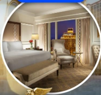
เดอะ เวนเซียน