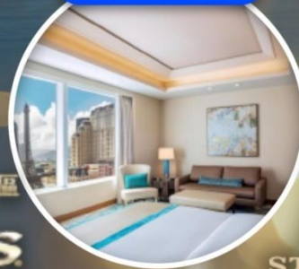
เดอะ เซนต์ รีจิส