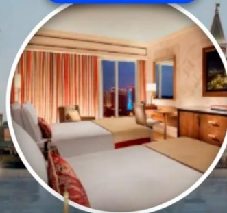
เดอะ ปารีสเซียน