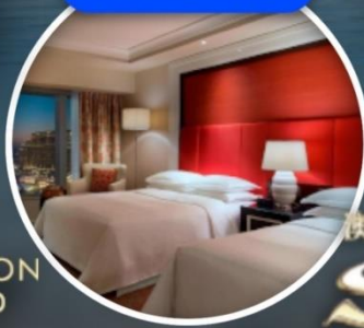
เซอร่าตันแกรนด์