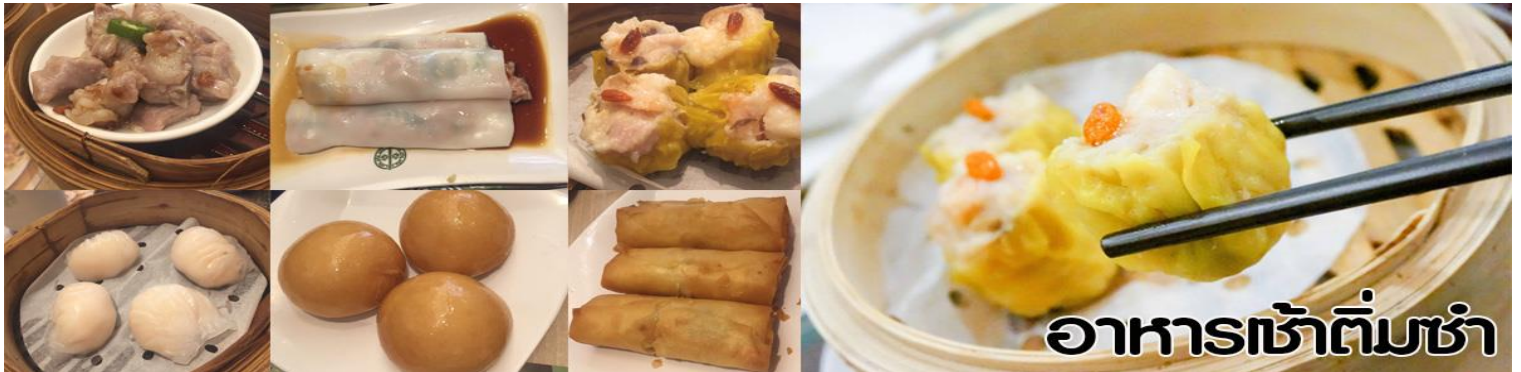
อาหารเช้าติ่มซำ