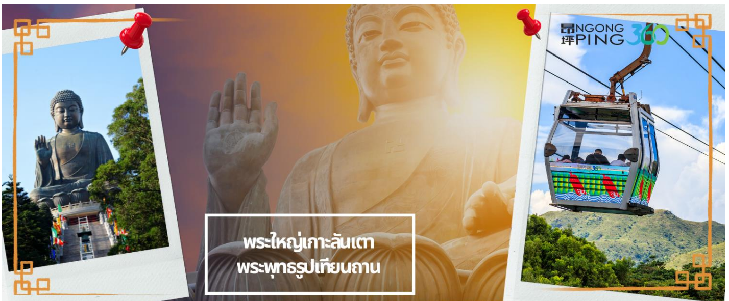
พระใหญ่เกาะลันเตา พระพุทธรูปเทียนถาน

นำท่านเดินทางสู่เกาะลันเตา เพื่อไปที่สถานีตุงซุง ท่านจะได้สัมผัสกับประสบการณ์ที่น่าตื่นตาตื่นใจจาก กระเช้าลอยฟ้านองปิง (NGONG PING SKYRAIL 360 **STANDARD CABIN**) ซึ่งถือได้ว่าเป็นแหล่งท่องเที่ยวอันมีเอกลักษณ์ระดับโลกของฮ่องกง ที่มีระยะทางกว่า 5.7 กิโลเมตร ใช้เวลาประมาณ 25 นาที ท่านจะได้สัมผัส