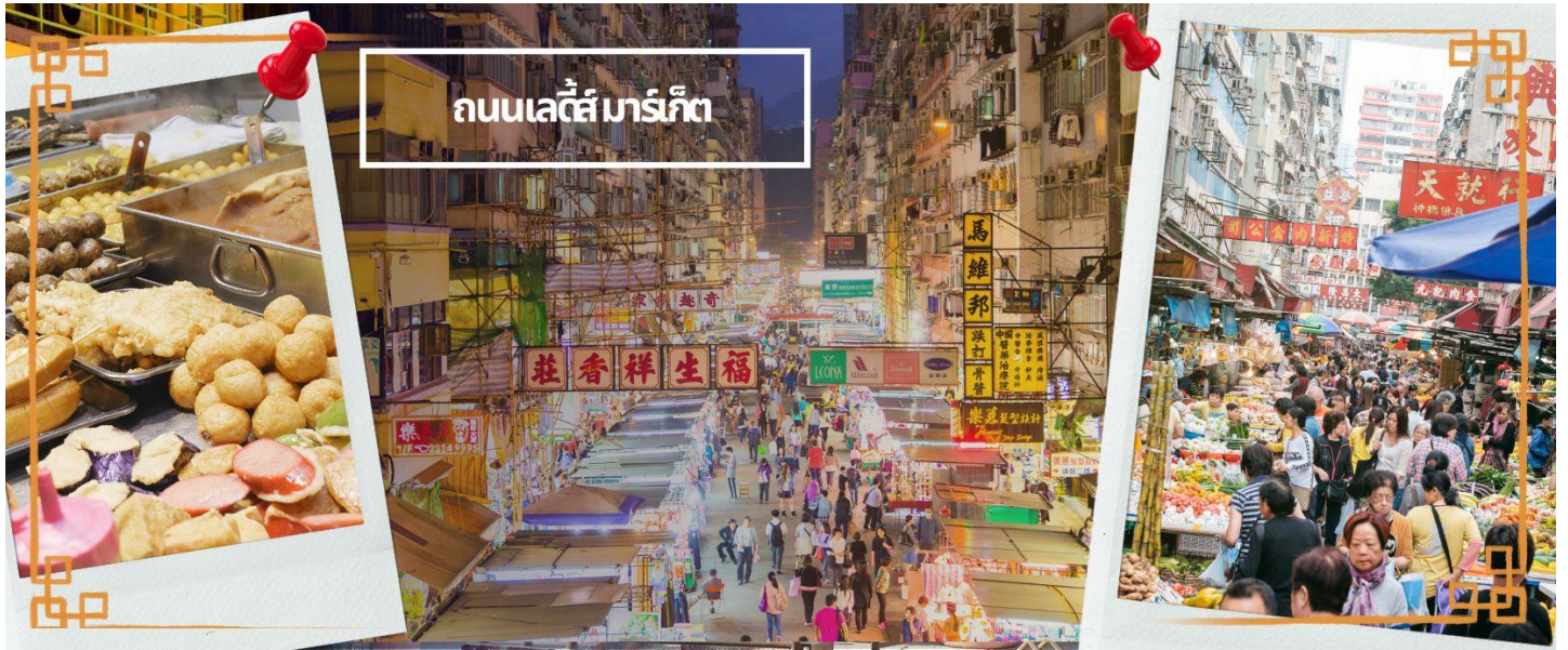
ถนนเลดี้มาร์เก็ต

จากนั้นนำท่านเดินทางสู่ ย่านมงก๊ก เป็นย่านที่มีความคึกคักที่สุดแห่งหนึ่งในเกาะฮ่องกงก็ว่าได้ เป็นสวรรค์ของนักช้อปปิ้งหนึ่งที่ สายช้อปปะพลาดไม่ได้ นับได้ว่าเป็นย่านช้อปปิ้งที่คึกคักมากอีกแห่งหนึ่งของฮ่องกง เพราะเป็นย่านช้อปปิ้งที่มีทั้งร้านค้า และคนที่มาช้อปปิ้งจากที่ต่าง ๆ มากมายไม่ขาดสายตั้งแต่กลางวันยันกลางคืน เป็นถนนช้อปปิ้งที่มีสีสันมาก ถ้าเทียบกับญี่ปุ่นแล้วก็เปรียบเหมือนการเดินทางอยู่ที่ชิบูย่าเลยก็ว่าได้ และยังมีทั้ง