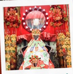
เจ้าแม่กวนอิมของย่า