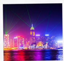
SYMPHONY OF LIGHT

บินสาย กลับง่าย 大湾区航空 GREATER BAY AIRLINES