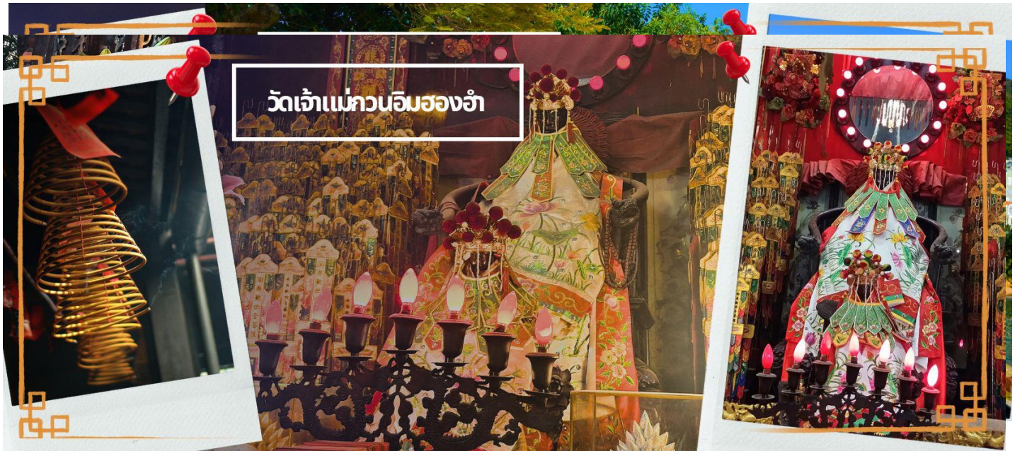
วัดเจ้าแม่กวนอิมฮองฮำ