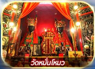
วัดหมื่นโหมว