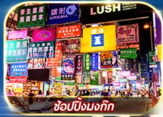
ซุปปิ้งมงก๊ก

เต็มอิ่ม ทั้งไหว้พระขอพร การเงิน การงานความรักและซุปปิ้ง