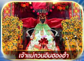
เจ้าแม่กวนอิมของฮำ