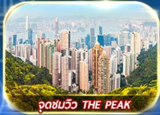
จุดชมวิว THE PEAK