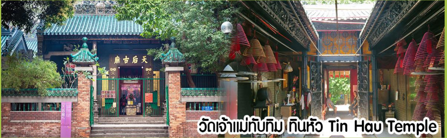
วัดเจ้าแม่ทับทิม ทินหัว Tin Hau Temple

ทำงานไถ่ดลๆ หรือออกหาปลา นอกจากการมาสักการะบูชาเจ้าแม่ทับทิมในเรื่องของการเดินทางให้ปลอดภัยแล้ว ไฮไลท์สำคัญอีกอย่างหนึ่งของวัดเจ้าแม่ทับทิม ทินหัว (Tin Hau Temple) จะเป็นขดรูปสี่แดงขนาดใหญ่ ที่แขวนอยู่ตามเพดานด้านในของวัดก็จะเป็นสถาปัตยกรรมแบบวัดจีน สร้างขึ้นตั้งแต่ปี ค.ศ. 1876 โดยทางเข้าของวัดจะอยู่ติดกับสวนสาธารณะเล็ก ๆ ที่มีต้นไม้ใหญ่หลายต้น ให้บรรยากาศร่มรื่น