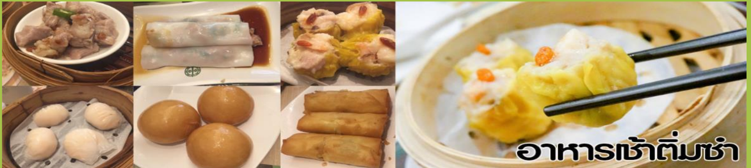
อาหารเช้าต้มซำ

เช้า รับประทานอาหารเช้า (ต้มซำ) ณ กัตตาดาร