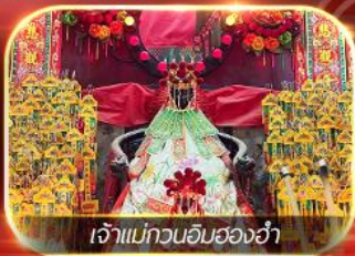
เจ้าแม่ทวนอิมของฮำ