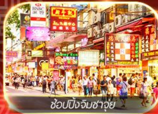
ซูปบิ่งจิมซาฮุย