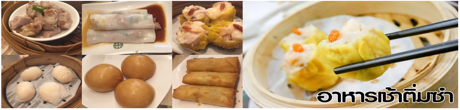
อาหารเช้าติ่มซำ

หลังจากนั้นนำคณะไหว้ขอพรเพื่อเป็นสิริมงคลที่ วัดหวังต้าเซียน 1 ใน 3 วัดที่ท่านต้องไหว้ในปีนี้ เป็นการแก้ปีชงที่สมบูรณ์แบบ โดยไม่ต้องไหว้ถึง 9 วัด วัดหวังต้าเซียนเป็นวัดเก่าแก่อายุกว่าร้อยปี ท่านเทพเจ้าห้วงซ้อเฟ่ง เป็นนักพรตมีความรู้ทางด้านการแพทย์ และได้ช่วยคนอย่างมากมายทำให้คนเหล่ายกย่องในตัวท่าน และได้ตั้งศาลเพื่อสักการะ ให้ท่านเป็นเทพว่องโทซัน คนในสมัยนี้มีความเชื่อเรื่องสุขภาพว่าเมื่อท่านรอยแค้โหน ก็ต้องมีที่ทุกคนต้องเจ็บป่วยก็เลยมีคนมาขอदानสุขภาพอย่างมากมายที่นี่ อีกสิ่งหนึ่งที่ผู้คนศรัทธาและนิยมทำเมื่อมาถึงวัดหวังต้าเซียนได้แก่ การเสี่ยงเซียมซีในวิหารเทพเจ้าหวังต้าเซียน โดยมีกระบอกเซียมซีมากถึง 50 ชุด ชาวฮ่องกงมีความเชื่อถือศรัทธาว่าเซียมซีวัดหวังต้าเซียนมีความแม่นยำเป็นอย่างยิ่ง