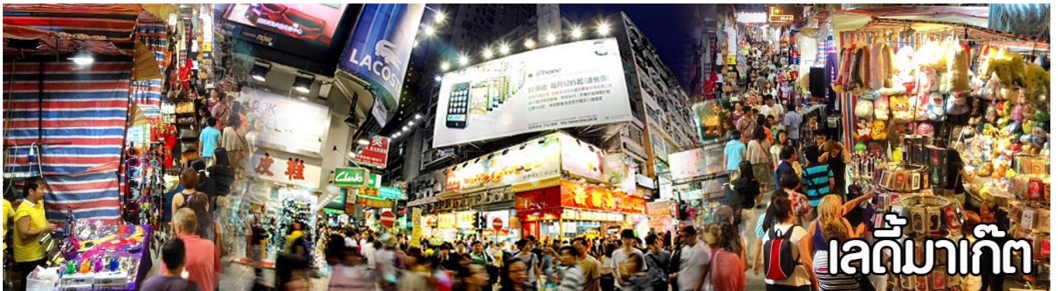
เลดี้มาร์เก็ต

จากนั้นอิสระให้ท่านช้อปปิ้ง ตลาดเลดี้ มาร์เก็ต (Ladies Market) เป็นตลาดบนถนนคนเดินสไตล์ Night Market แบบบ้านเรา ไม่ได้มีขายเฉพาะแต่ของผู้หญิงแต่มีของขายทุกอย่าง เหมือนพวกตลาด Night ของบ้านเรา โดยจะปิดถนน Tong Choi Street ตั้งแต่แยกที่ตัดกับถนน Argyle Street ยาวตลอดถนน Tong Choi Street ไปจนถึงถนน Dundas Street ยาวประมาณ 500 เมตร สินค้าที่ขายกันจะมีอยู่หลากหลายแบบเช่นพวกตัวการ์ตูนต่าง ๆ จากดิสนีย์, Marvel และจากญี่ปุ่น ประเภทสินค้า เสื้อผ้า นาฬิกากระเป๋า ตุ๊กตา ของฝาก ของที่ระลึก ต่างๆใครต้องการจะซื้อของที่ระลึกหรือของฝากต่างๆของฮ่องกงก็สามารถมาเดินเลือกซื้อกันได้ที่นี่