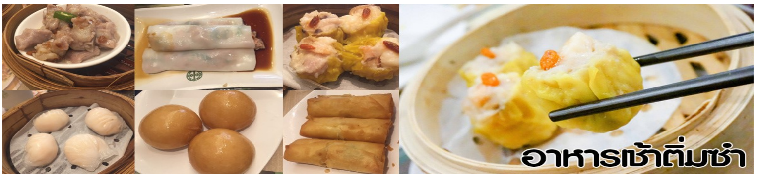
อาหารเช้าติ่มซำ