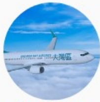
ตั๋วเครื่องบิน