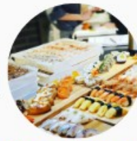
Buffet Afternoon Tea