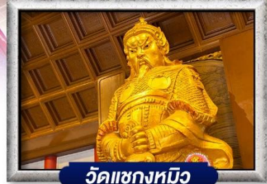
วัดเขangkงหมิว