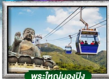
พระใหญ่นองปิง