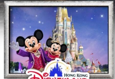
HONG KONG Disneyland

ชมการแสดง แสง สี เสียง Symphony of Lights