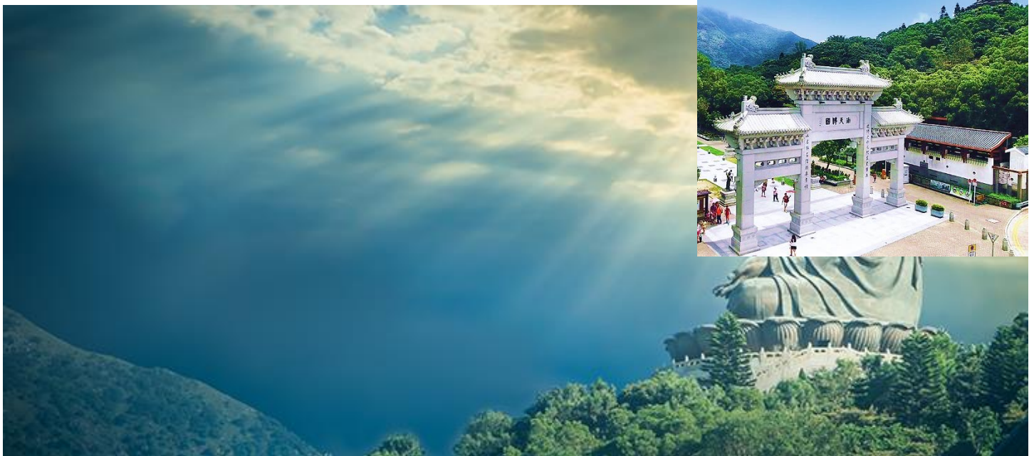
รอบๆ บริเวณฐานองค์พระ

นำท่านขอพร พระใหญ่เทียนถาน ณ ลานอธิษฐาน ให้ทุกท่านได้ตั้งจิตอธิษฐานขอพรไม่ว่าจะเป็นเรื่องสุขภาพ การงานการเงิน เนื่องจากองค์พระเป็นปรากฏ์ประทานพรจากลานอธิษฐาน ท่านสามารถเดินขึ้นชมฐานองค์พระได้ โดยจะมีบันไดทอดยาวจำนวน 268 ขั้น หรือชมวิวของเกาะลันเตาในมุมสูงได้ และยังมีรูปปั้นของเทพธิดาถวายเครื่องสักการะตามความเชื่อของนิกายมหายานประดิษฐานอยู่