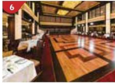
6 Dream Dining Room Savour a wide variety of Asian and international cuisine.