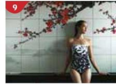
9 Crystal Life™ Spa Rejuvenate mind, body and soul with our holistic Western and Asian spa experience.