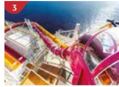
3 Waterslide Park Get drenched in fun on one of our six different waterslides.