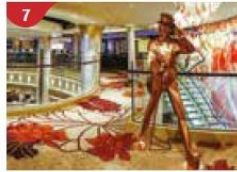
7 Johnnie Walker House™ Immerse yourself in the intricate world of premium Scotch whisky.