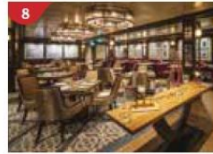
8 Bistro By Mark Best Relish contemporary Western cuisine from the internationally-acclaimed Australian chef.