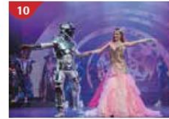
10 Zodiac Theatre Enjoy live production shows from the acclaimed award-winning entertainment team.