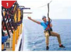
1 Ropes Course & Zipline Feel the thrill of gliding above the ocean on a 35-metre zipline.