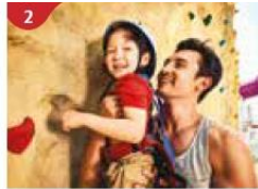
2 Rock Climbing Wall Challenge yourself on our mountainous rock climbing wall.