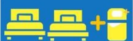
เตียง 3 ก้น ที่นอนเสริม TRIPLE