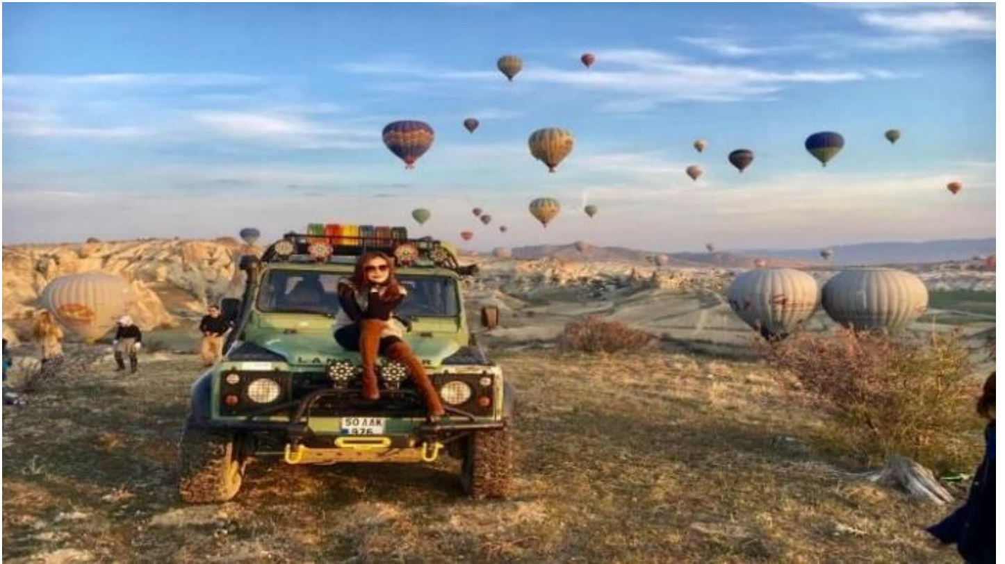
3. Classic Car นั่งรถคลาสสิก เปิดประทุน สูดอากาศ เย็น สดชื่น พร้อมชมบอลลูนสีสดใส วิวเมือง คัปปาโดเกีย ค่าใช้จ่าย 120 USD / ท่าน