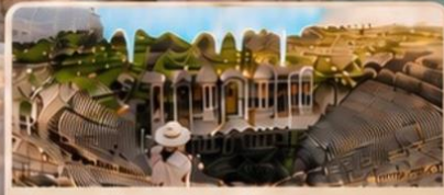
เมืองเซียราโพลิส