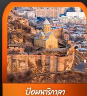
ป้อมพริกกาลา