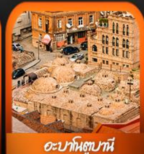
อะบาโนทซุขานี

เดินทาง 29 ต.ค.-05 พ.ย. 69 20-27 พ.ย. 69 / 09-16 ธ.ค.69