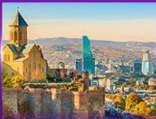
นั่งกระเช้าชมวิว ป้อมนากริธา