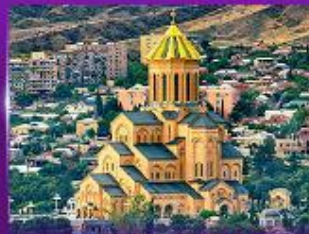
โบสถ์ศักดิ์สิทธิ์เกอร์เกติ