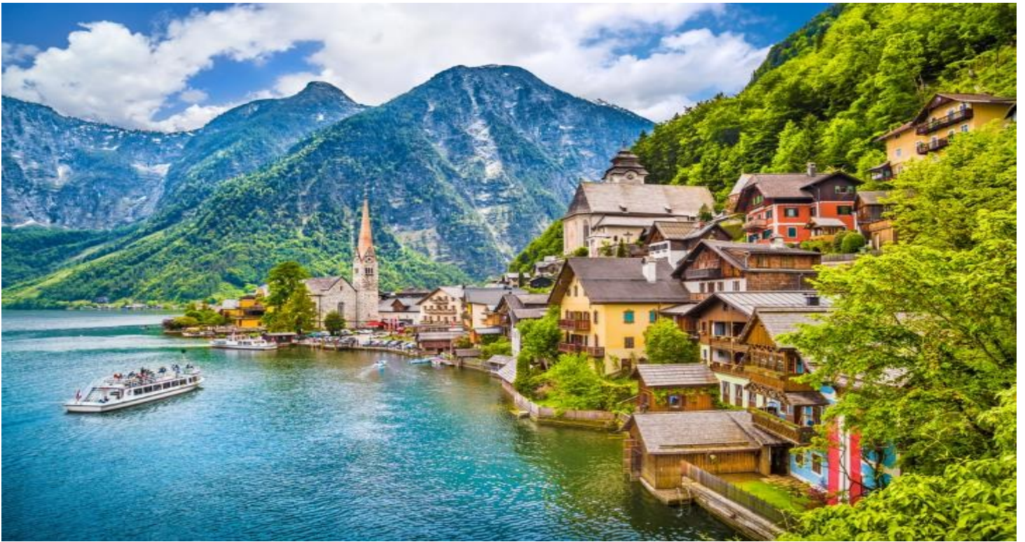
กลางวัน รับประทานอาหารกลางวัน ณ ภัตตาคารพื้นเมือง (ปลาจากทะเลสาบฮัลสตัท)