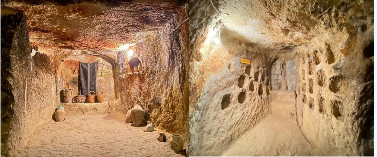
แนวถ่ายรูป หุบเขาอุชิซาร์ (UCHISAR VALLEY) หุบเขาคัลายจอมปลวกขนาดใหญ่ ใช้เป็นที่อยู่อาศัย ซึ่งหุบเขาดังกล่าวมีรูพรุน มีรอยเจาะ รอยขุด อันเกิดจากฝีมือมนุษย์ไปเกือบทั่วทั้งภูเขา เพื่อเอาไว้เป็นที่อยู่อาศัย