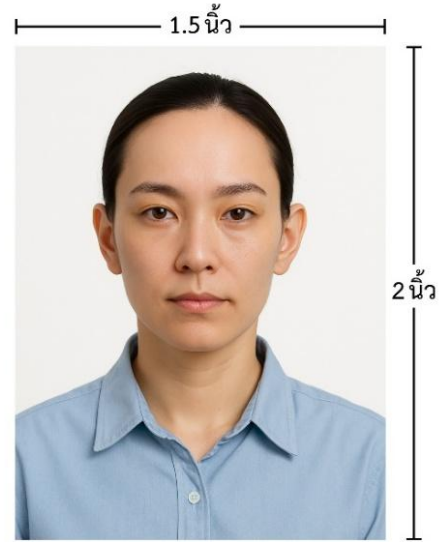
ขนาดรูปตัวอย่างใช้ยื่น Visa

*** ห้ามขีดเขียน แม็ก หรือใช้คลิปลวดหนีบกระดาษ ซึ่งอาจส่งผลให้รูปถ่ายชำรุด และไม่สามารถใช้งานได้ ***