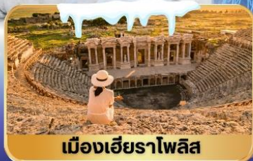
เมืองเฮียราโพลิส