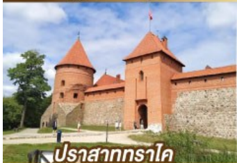
ปราสาททราโค