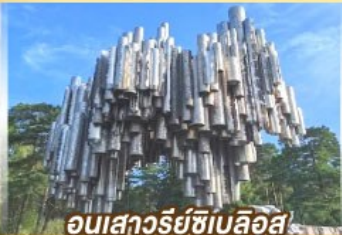
อนุสาวรีย์ซีเบลลูส