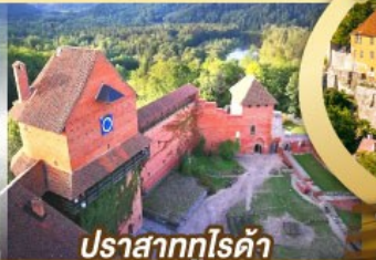
ปราสาทกูโรต้า