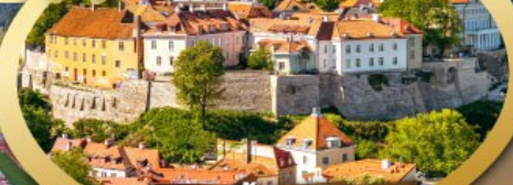
3 เมืองสวยจิ่งของกลุ่มบอลติก และเก็บไฮไลท์ประจำเมืองเฮลซิงกิ และล่องเรือเฟอร์รี่ข้ามประเทศ

ไฮไลท์ในโปรแกรม • เที่ยวสามประเทศหลักกลุ่มบอลติก • ชมเมืองหลวงวิลนิอุส ประเทศลัตเวีย