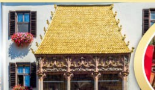
หลังคาทองคำอินน์สบูร์ค