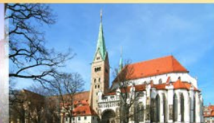
มหาวิหารอาคัสบวร์ค