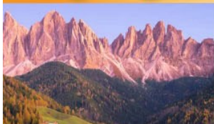
อุทยานแห่งชาติโดโลไมท์

บินตรงนครอัมสเตอร์ดัม กับเส้นทางสายโรแมนติก พร้อมการแสดงพื้นบ้านสไตล์ที่โรเลียนสุดพิเศษ