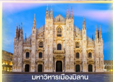
มหาวิหารเมืองมิลาน