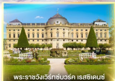
พระราชวังแวร์ซายส์บวร์ค เรสซิเดนซ์