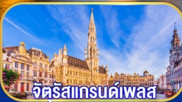
จัตุรัสแกรนด์เพลส