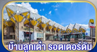
บ้านลูกเต๋า รอตเตอร์ดัม

เยือนเมืองเก่าแก่อูเทรคต์ เก็บไฮไลต์กลุ่มประเทศเบเนลักซ์ กับการบินไทย บินตรงอัมสเตอร์ดัม