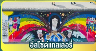
ฮิสซิค์เทลเลอร์