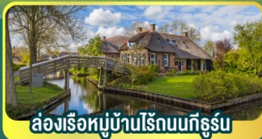
ล่องเรือหมู่บ้านไรกนทึร์น