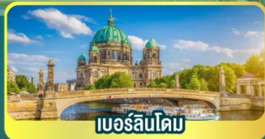
เบอร์ลินโดม