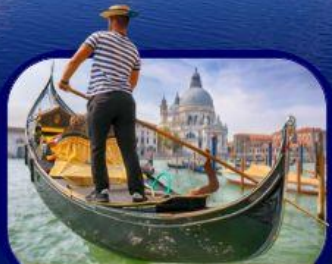
เที่ยวเกาะเวนิส