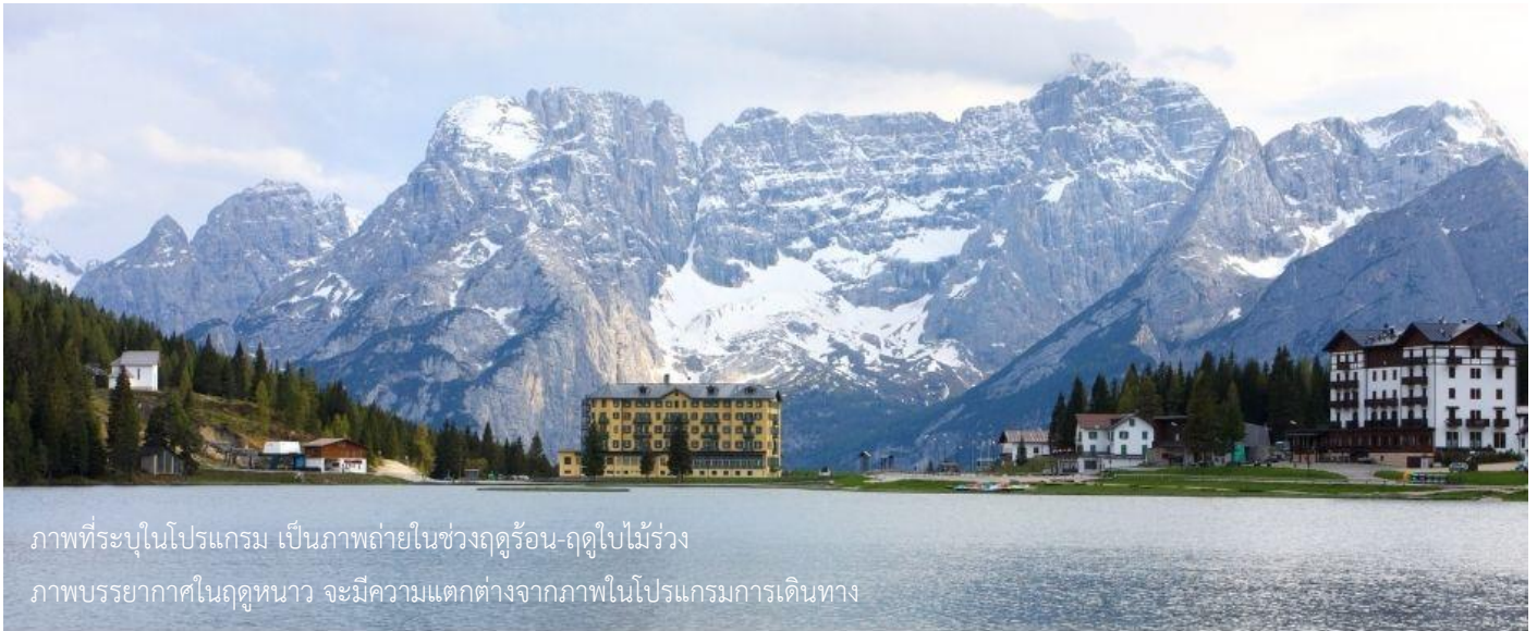
ภาพที่ระบุในโปรแกรม เป็นภาพถ่ายในช่วงฤดูร้อน-ฤดูใบไม้ร่วง ภาพบรรยากาศในฤดูหนาว จะมีความแตกต่างจากภาพในโปรแกรมการเดินทาง