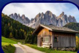
อุทยานฯ โดโลไมท์