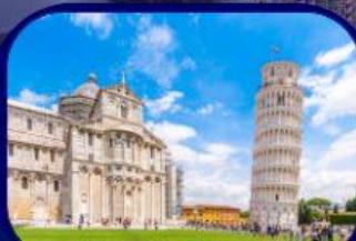
หอเอนแห่งเมืองปิซ่า