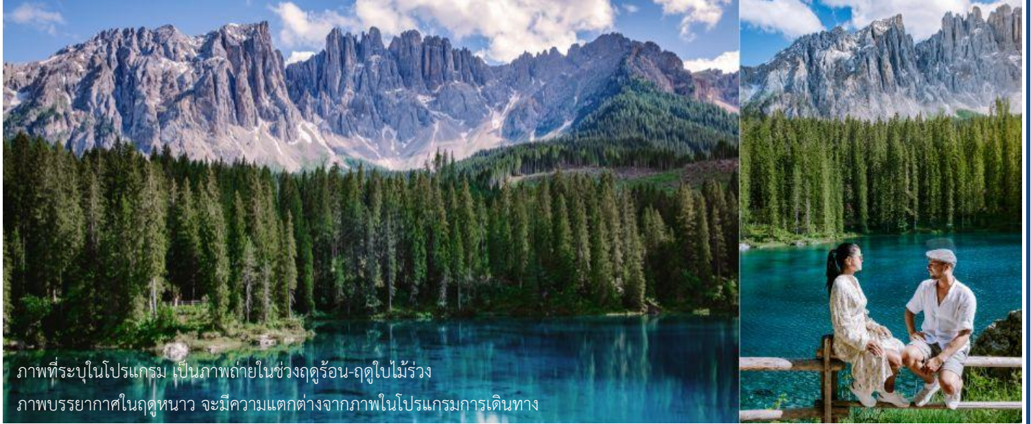
ภาพที่ระบุในโปรแกรม เป็นภาพถ่ายในช่วงฤดูร้อน-ฤดูใบไม้ร่วง ภาพบรรยากาศในฤดูหนาว จะมีความแตกต่างจากภาพโปรแกรมการเดินทาง

มองเห็นได้อย่างชัดเจนจากทุกมุมมอง ท่านจะได้ชมความงามของภูเขา Dolomites ซึ่งได้รับการขึ้นทะเบียนเป็นมรดกโลกจากยูเนสโก ถึงเวลาอันสามครรนำท่านเดินทางกลับลงมาที่ตัวเมืองออดิเซ่