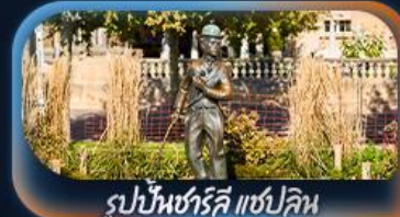
รูปปั้นชาร์ลี แชปลิน

เที่ยวครบจบทุก Highlight ตะลุยจุงเฟรา วิวอลังการจัดเต็มสมชื่อ Top Of Europe สักครั้งในชีวิตหมู่บ้านเซอร์แมท นั่งรถไฟสาย Gornergrat bahn หมู่บ้านเลาเทอร์บรุนเนินสวยเหมือนเทพนิยาย เปิดประสบการณ์โรแมนติกส่องเรือทะเลสาบรุน ทะเลสาบเจนีวา น้ำพุจรวดเจ๊กโต ศาลาไทย รูปปั้นชาร์ลี แชปลิน The Fork ปราสาทซิลยอง หมู่บ้านอิซลทอวัลด์ สิงโตแกะสลัก สะพานไม้ชาเปล โบสถ์ฟรอมุนสเตอร์ ซ็อบบิงจุงถนนบานโฮฟชตราเซอร์