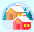
เมืองเซอร์แมท

เช้า บริการอาหารเช้า ณ ห้องอาหารของโรงแรม (11)