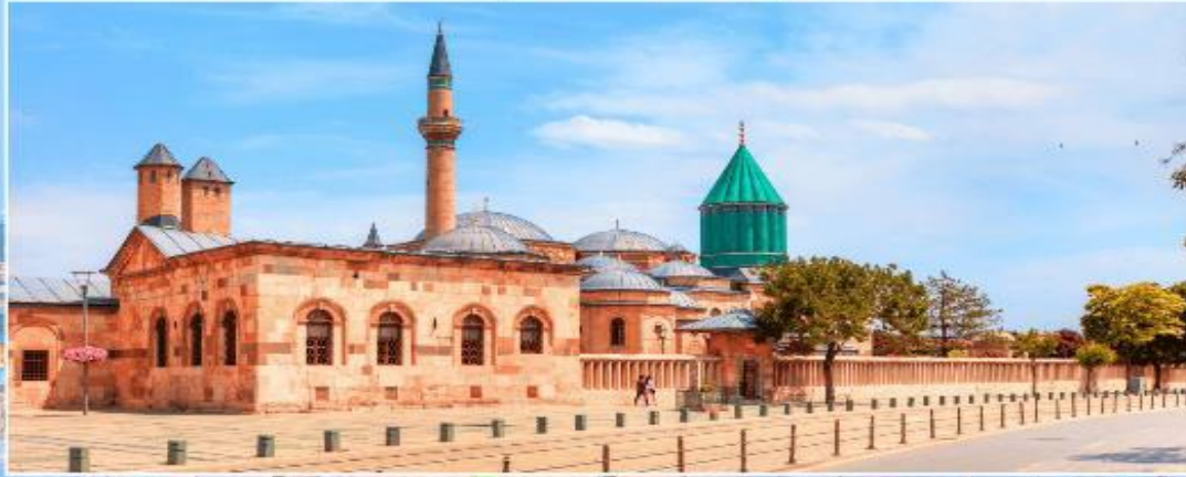
พิพิธภัณฑ์เมฟลานา KONYA

เดินทางสู่ เมืองปามุกคาล่ (PAMUKKALE) แปลว่า ปราสาทปุยฝ้าย อยู่ในเมืองชื่อเดียวกัน จังหวัดเดนิซลี ประเทศตุรเคีย เป็นเนินเขาหินปูนสีขาว มีความยาวประมาณ 2.7 กิโลเมตร สูง 160 เมตร เกิดจากน้ำพุร้อนที่นำแคลเซียมคาร์บอเนตมาตกตะกอน ปามุกคาล่ ได้รับการขึ้นทะเบียนเป็นแหล่งมรดกโลกร่วมกับฮีเอราโปลิสซึ่งเป็นเมืองโบราณที่ตั้งอยู่บนปามุกคาล่ ใน พ.ศ. 2531 (ใช้เวลาเดินทางประมาณ 5.30 ชั่วโมง)