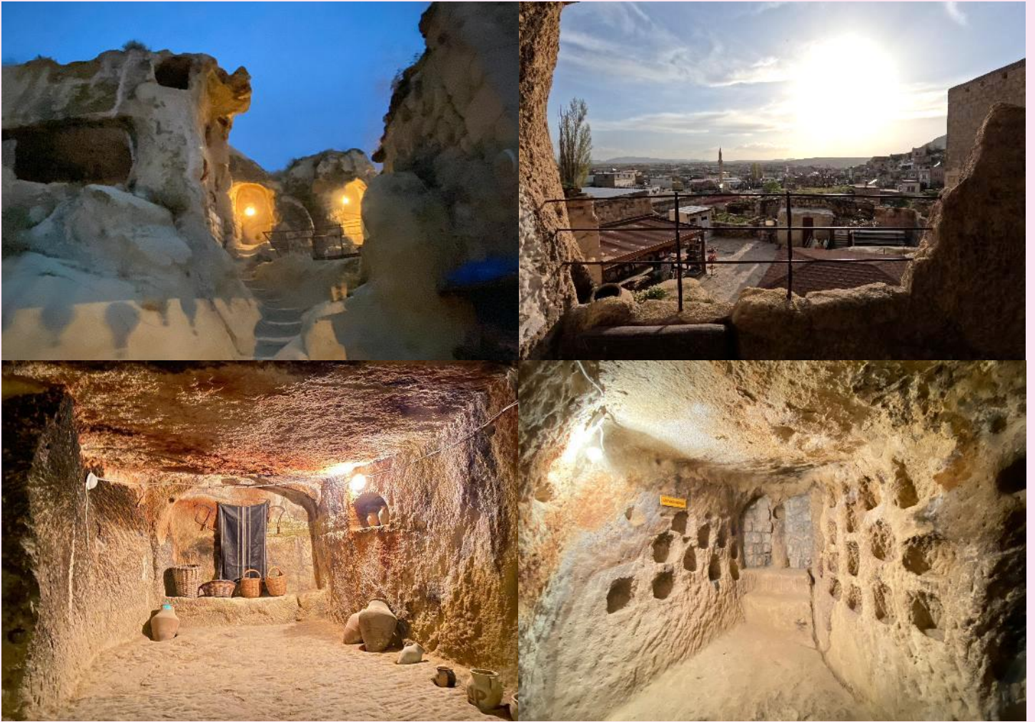
แฉะถ่ายรูป หุบเขาอุชิซาร์ (UCHISAR VALLEY) หุบเขาคัล้ายจอมปลวกขนาดใหญ่ ใช้เป็นที่อยู่อาศัย ซึ่งหุบเขาดังกล่าวมีรูพรุน มีรอยเจาะ รอยขุด อันเกิดจากฝีมือมนุษย์ไปเกือบทั่วทั้งภูเขา เพื่อเอาไว้เป็นที่อยู่อาศัย