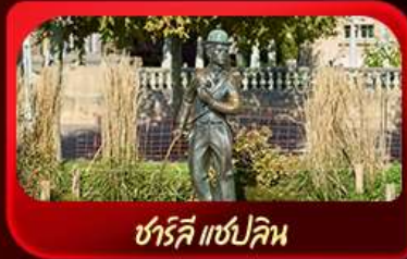
ชาร์ลี แชปลิน