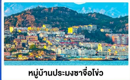
หมู่บ้านประมงซาจื่อโจว