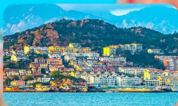
หมู่บ้านประมงชาจื่อโจว