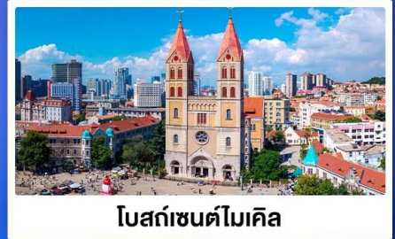
โบสถ์เซนต์โมเคิล