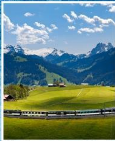
GOLDEN PASS LINE Montreux-Zweisimmen