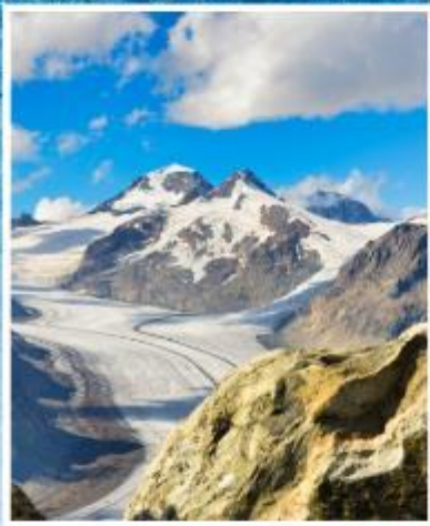
ALETCH GLACIER Riederalp, Bettmeralp

แกรนด์สวิตเซอร์แลนด์ 9 วัน พักหมู่บ้านเชอร์แมท