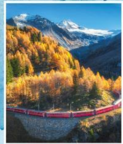
BERNINA EXPRESS Unesco