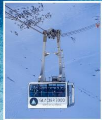
GLACIER3000 Peak walk by Tissot