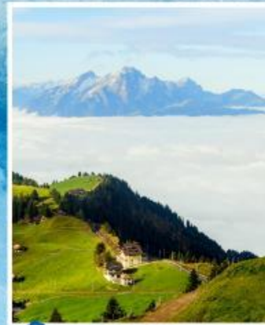
RIGI KULM Queen of the Mountains