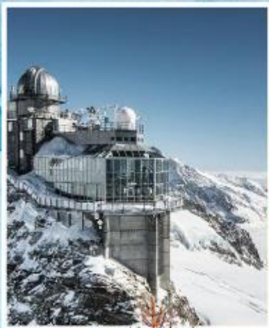
JUNGFRAUJOCH "Top of Europe"