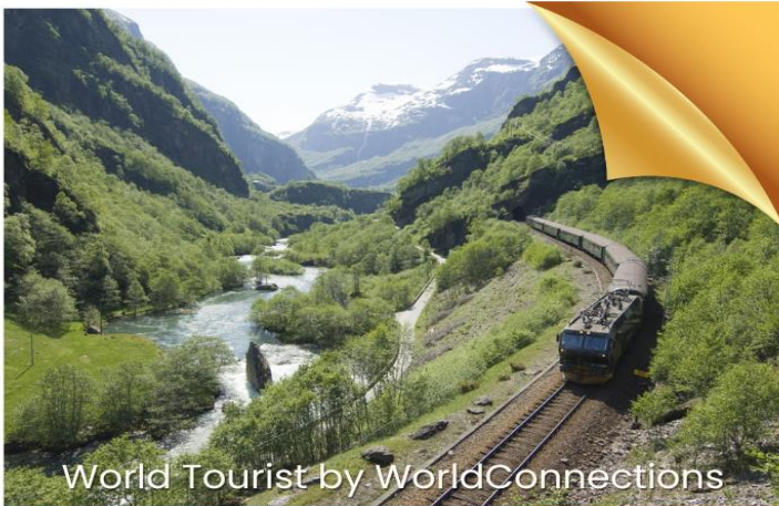
World Tourist by WorldConnections

เมืองหลวงอันคึกคักของฟินแลนด์ ผสมผสานสถาปัตยกรรมของรัสเซียและฟินแลนด์