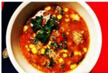
Manestra (Bean Minestrone)