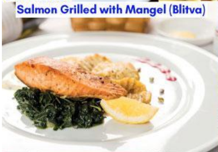
Salmon Grilled with Mangel (Blitva)