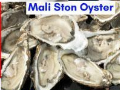
Mali Ston Oyster