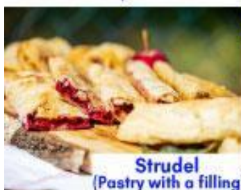
Strudel (Pastry with a filling)