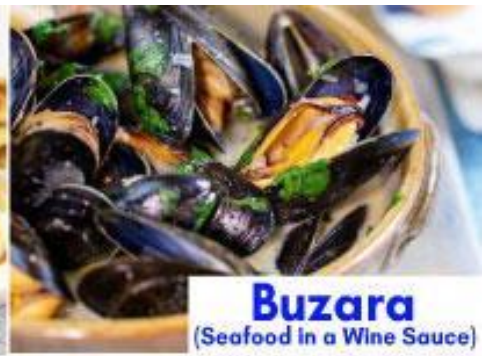
Buzara (Seafood in a Wine Sauce)