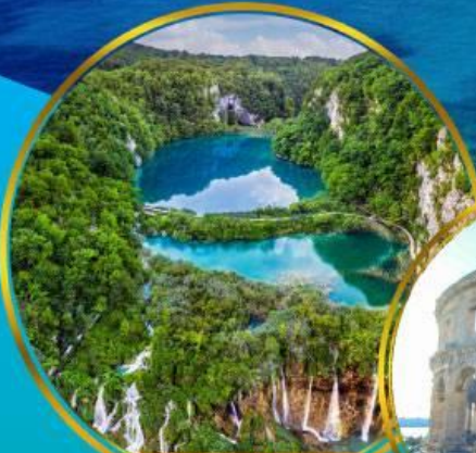
อุทยานแห่งชาติ ทะเลสาบพลิทวิเซ