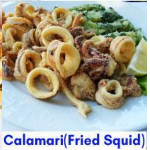
Calamari (Fried Squid)