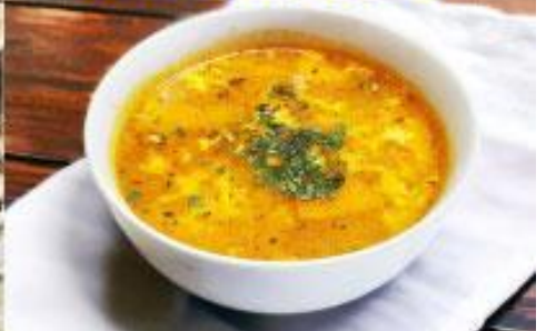
Brudet (Spicy Fish Stew)