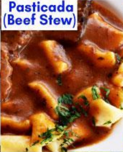
Pasticada (Beef Stew)