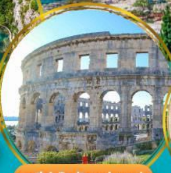
อารีนาโรมันแห่งปูลา