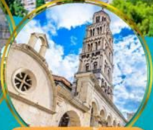
พระราชวัง โตโอคลีเซียนแห่งสปลิต