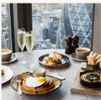
DUCK AND WAFFLE