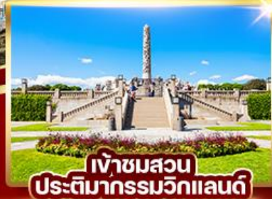
เฝ้าชมสวน ประติมากรรมวิกแลนด์