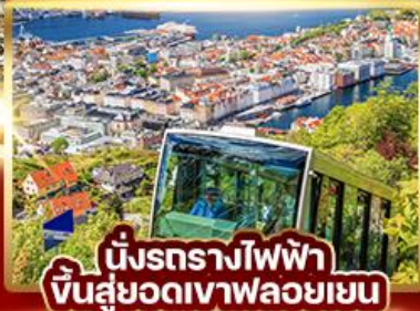
นั้รทรางไฟฟ้า ขึ้นสู่ยอดเขาฟลอยเยน

สต็อกโฮล์ม (สวีเดน) • ชมเมืองคาร์ลสตัด วอสโกล • จุดชมวิวกานาสกี • โทล • ฟลัม ล่องเรือซอนน์ฟยอร์ด(มรดกโลก) • วอสส นั้รทไฟสายฟลัมสบานา • เบอร์กิน นั้รทรางฟลอยบานน • จุดชมวิวกฟลอยเยน ตลาดปลา • หมู่บ้านมริกเกน