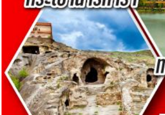
เมืองดำอพลิสซิคี