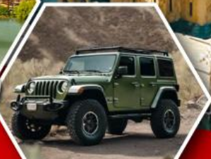
ขึ้นรถ 4WD สู้อีกกลาง เทือกเขาคอเคซัส

ขึ้นรถ 4WD สู้อีกกลางเทือกเขาคอเคซัส ราคาเริ่มต้น