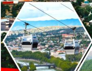
กระเช้านาริการ์