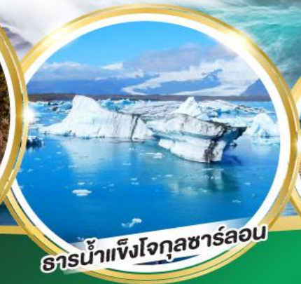
ธารน้ำแข็งโจกุลซาร์ลอน