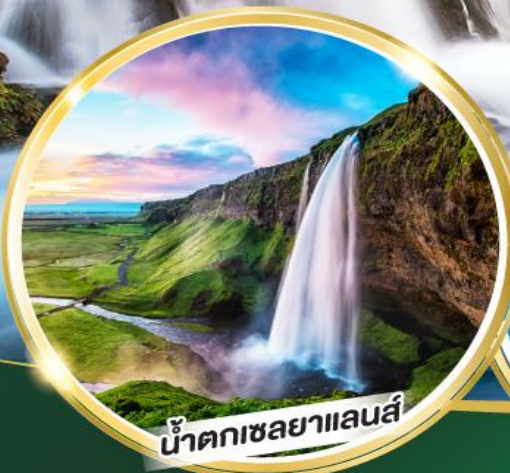
น้ำตกเซลยาแลนส์