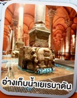
อ่างเก็บน้ำเยเรบาดัน