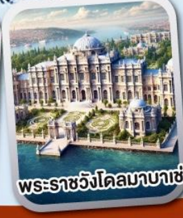
พระราชวังโดลมาบาเย