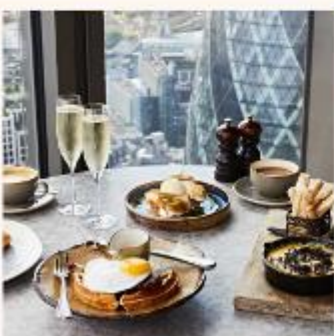
DUCK AND WAFFLE